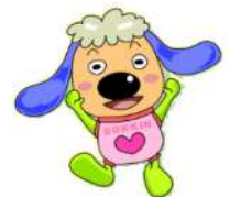
公正取引委員会 キッズキャラクター 「どっきん」